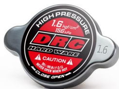
ラジエターキャップ寸法図